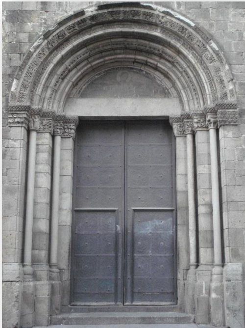
PORTE # 1