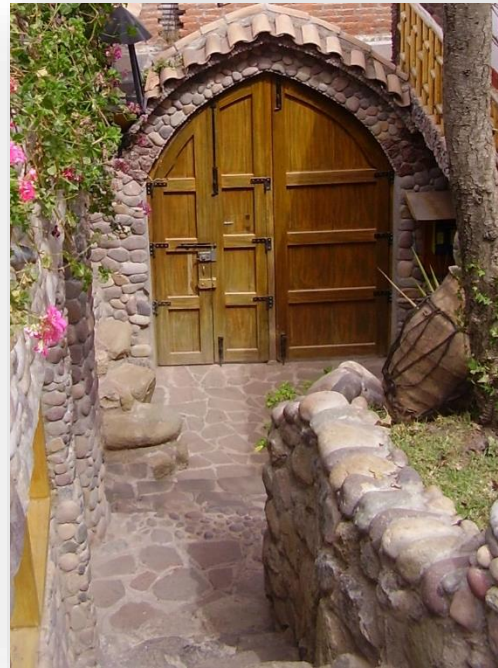
PORTE # 2